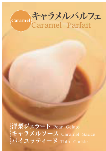
Caramel キャラメルパルフェ Caramel Parfait

ブドウジェラート Grape Gelato イチゴソース Strawberry Sauce