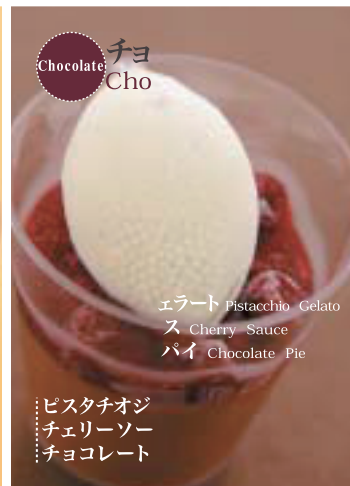
Chocolate チョコ Cho

洋梨ジェラート Pear Gelato キャラメルソース Caramel Sauce パイユッティース Thin Cookie